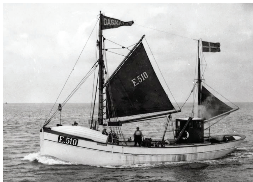
E510 DAGMAR AAEN NJKC-OWEB