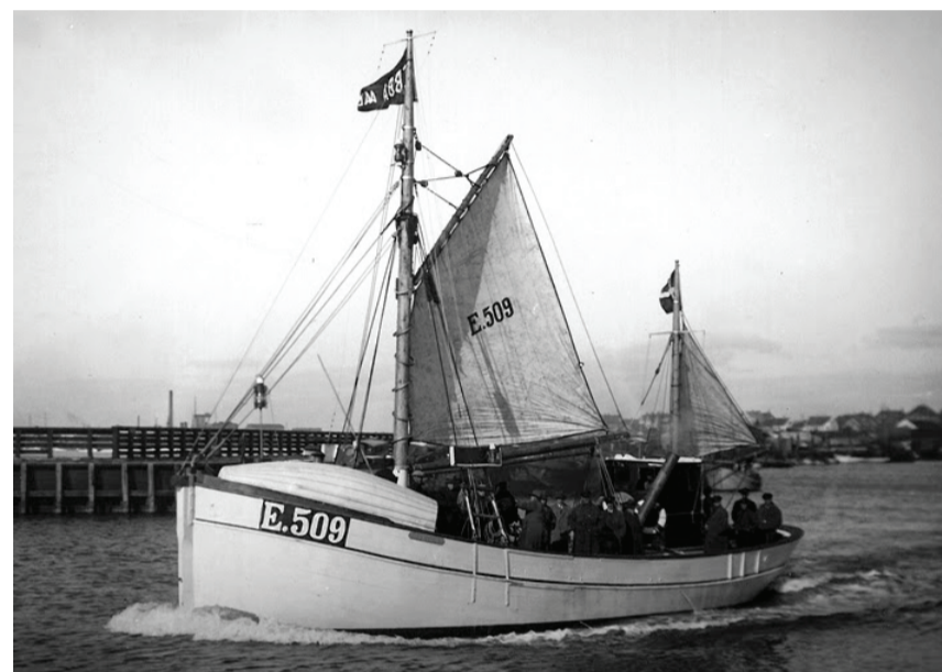
E509 EBBA AAEN NJGT-OWEY