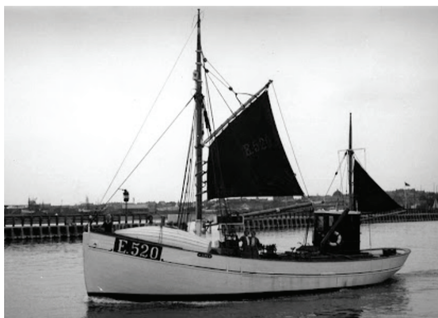
E520 AMI OYPE