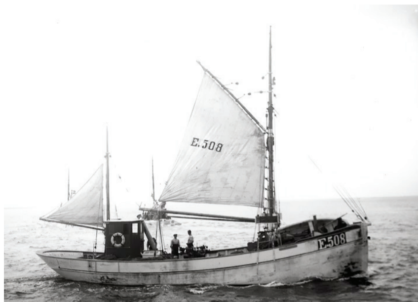
E508 GUDRUN AAEN NHTF-OWKI