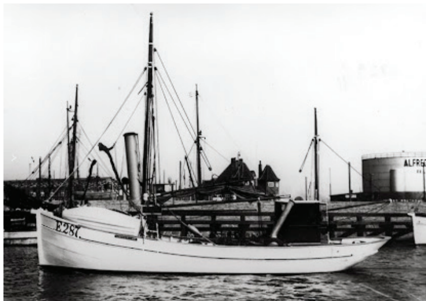
E 278 AJAX NBFT-OYLF