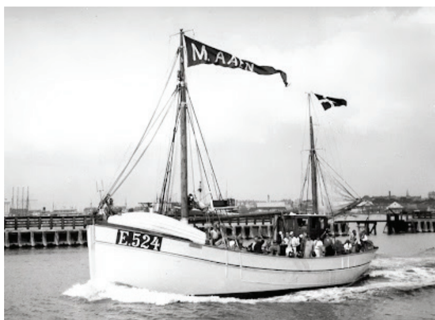
E524 M AAEN OYSJ